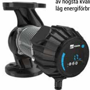
CIRKULATIONSPUMPAR av högsta kvalitet med låg energiförbrukning.