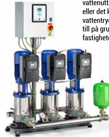
TRYCKSTEGRING när vattenuttaget blir stort eller det kommunala vattentrycket inte räcker till på grund av höjden på fastigheten.