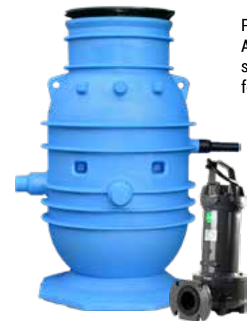
PUMPSTATIONER OCH AVLOPPSPUMPAR i olika storlekar och modeller för alla behov.