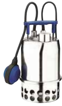
LÄNSPUMPAR för vattenförflyttning till dammar och tömning av pooler och andra vattensamlingar.