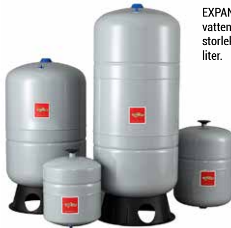
EXPANSIONSKÄRL för vattenburna system i storlekar från 2 till 450 liter.