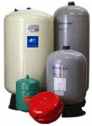
TRYCKKÄRL som begränsar pumpens start och stopptillfällen samt agerar buffertank vid dålig tillrinning i borrhål eller brunn.